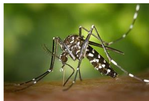
1: Asiatische Tigermücke